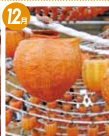
JAふくしま未来の あんぼ柿