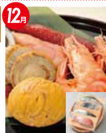
おのざき 海鮮セット