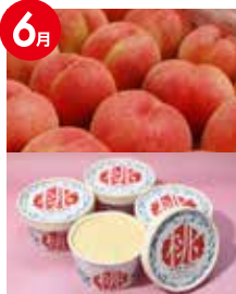
至福の桃 満足セット