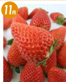
ブランドいちご ふくはる香