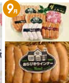
ノーベルの こだわりギフトセット