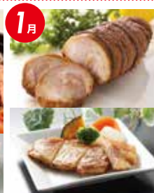
ブランド豚 「エゴマ豚」セット