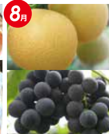
秋の フルーツセット