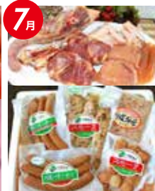
川俣シャモ 堪能セット