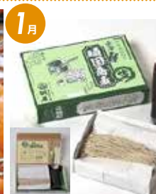
会津頑固 生そばセット