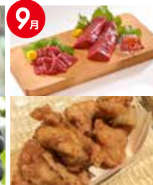
会津肉食べ つくしセット