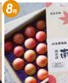
JA会津よつばの 南郷トマト