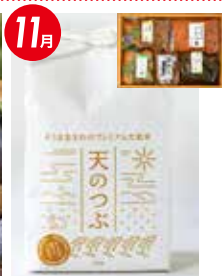
相馬産天のつぶと ご飯のお供セット