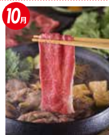
福島牛 すき焼きセット