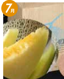
会津 アールスメロン