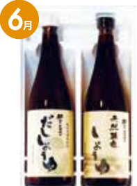
若喜商店 醤油セット