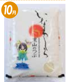
会津産 「里山のつば」