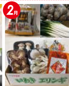
特産キノコと お味噌汁セット